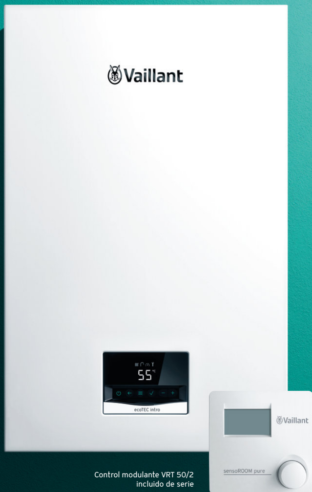
Control modulante VRT 50/2 incluido de serie

Mixtas instantáneas Caldera de condensación ultracompacta